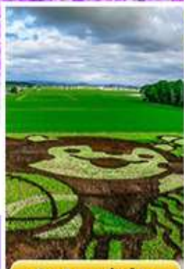
ศิลปะบนทุ่งข้าว