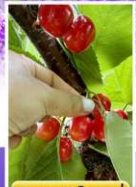
กิจกรรมเก็บเชอร์รี่