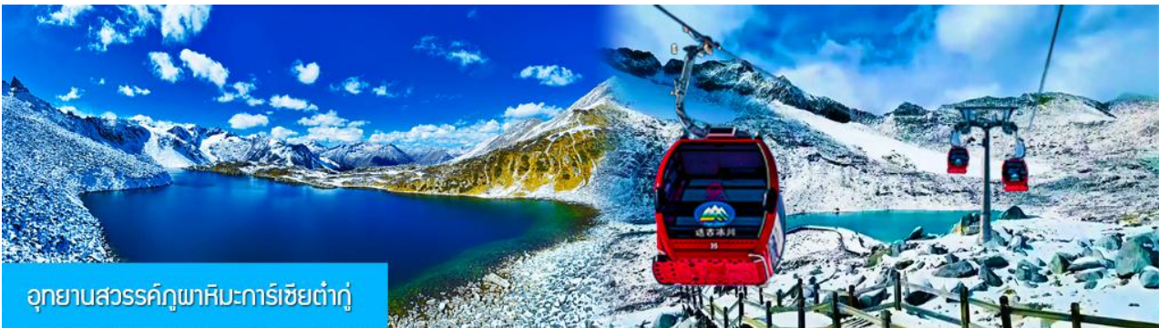
อุทยานสวรรค์ภูผาหิมะการ์เซียต้ากู่

วันที่สี่ ไกด์นำเสนอ OPTIONAL TOUR อุทยานภูเขาหิมะต้ากู่ – หมู่บ้านทิเบต-เมืองตูเจียงเยียน-สะพาน หนานเฉียว