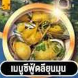
เบบู้ชี่ฟู้ดลือมุน