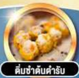
ติ่มซำคั่นตำรับ

เดินทาง พ.ค. 69 | 16-18, 23-25 มี.ย. 69 | 1-3