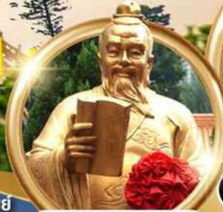
ผูกค้ายแดงขอความรัก