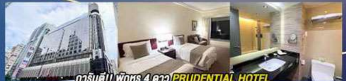
การันตี!! พักทรู 4 ดาว PRUDENTIAL HOTEL ติดถนนนาธาน ย่านช้อปปิ้งจิมซาจู้