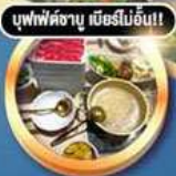
บุฟเฟ่ต์จาก มื้ออื่น!!