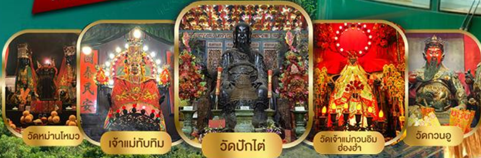
วัดน่านโหมว

ไหว้พระเสริมดวงแบบจัดเต็ม รวมขึ้นพีคแกรม