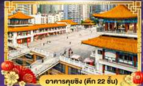
อาคารคยฉิ่ง (ตึก 22 ชั้น)