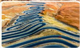
ถนนผานหลงกู่ต้าอว