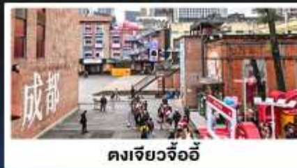
ตงเจียวจ้อ