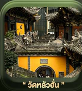
“ วัดหลิวอัน ”