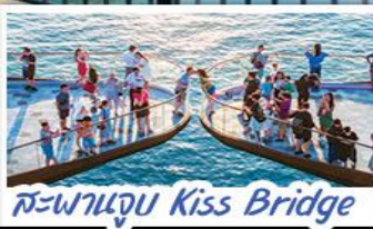
สะพานจูบ Kiss Bridge