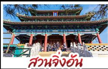
สวนจิ่งอัน