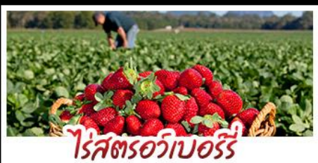
ไร้สตรอบออร์รี่

คฤหาสน์เหวินเจิง - สวนซาถูระซิงเต่า ไร้สตรอบออร์รี่ - โรงเบียร์ซิงเต่า