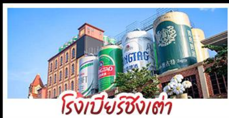
โรงเบียร์ซิงเต่า