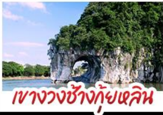
เขาวงวงช้างกุ้ยหลิน

ห้องเรือแม่น้ำลี่เจียง สวนสตรอว์เบอร์รี่ ทัศนียภาพที่สวยงาม นั่งบอลูนชมวิว 360 องศา ทางวงช้างกุ้ยหลิน ท้ายลุย้อ พาหุรุ้อ เมืองกุ้ยหลิน รถไฟความเร็วสูง พักโรงแรมระดับ 5 ดาว เมบูอาหารพิเศษ POP MART