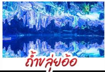
ถ้ำขลุ่ย้อ