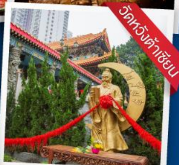
วัดหวงต้าเซี่ย