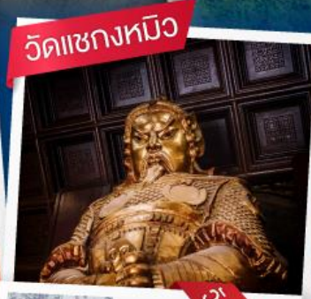
วัดแซงหนิว