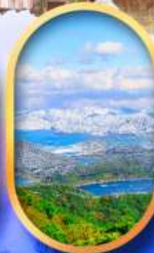
ทะเลสาบมิกะตะ