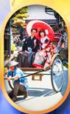
ศาลเจ้าจิ้งจอก