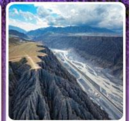
แกรนด์แคนยอนคู่ซานจื่อ