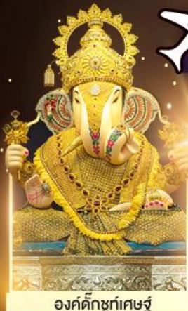
องค์ดีกษุท์เศษฐ์