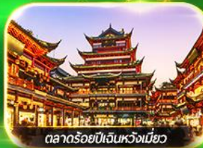
ตลาดร้อยปีเงินหวงเหมียว