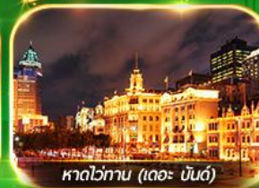
หาดไข่มุก (เดอะ บันด์)

เที่ยวมหานครเซี่ยงไฮ้ ถ่ายรูปเช็คอินท์ Tian An 1000 Trees, ซินเทียนตี้ ช้อปปิ้งตลาดเงินหวงเหมียว, ถนนนานกิง