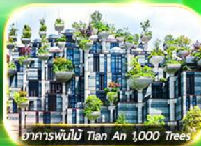
อาคารพันไม้ Tian An 1,000 Trees