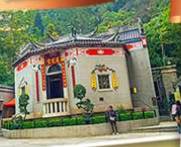
องค์อ้อยส้ม