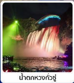
น้ำตกหวงกั๋วซู่