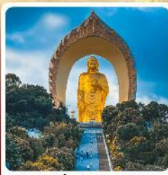
พระใหญ่ตงหลิน