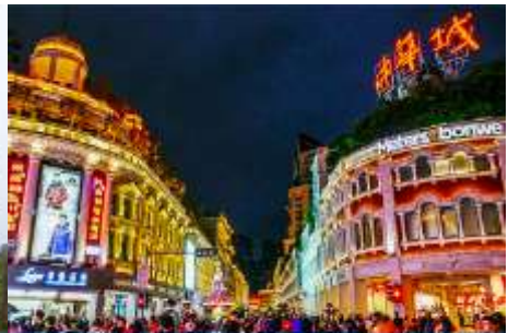
ถนนคนเดิน จวซาลู่