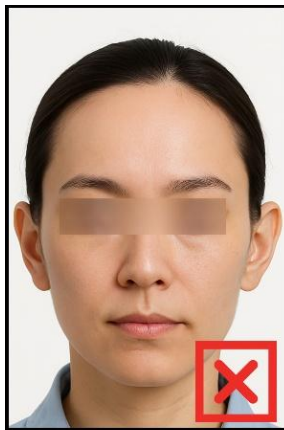
รูปที่ไม่ได้ขนาด ตามที่สถานทูตกำหนด