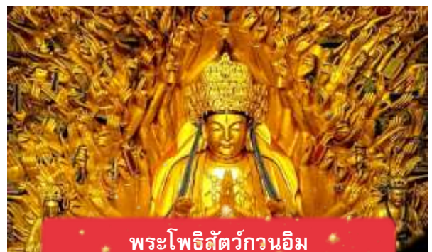
พระโพธิสัตว์กวนอิม

นำท่านเดินทางสู่ มรดกโลกอุทยานผาหินแกะสลักต้าจู๋ ศิลปะหินแกะสลักอันล้ำค่าแห่งเมืองฉงชิ่งมรดกโลกที่องค์การยูเนสโกขึ้นทะเบียนเมื่อปี ค.ศ. 1999 ตั้งอยู่ทางตะวันตกของนครฉงชิ่ง ประเทศจีน ศิลปะหินแกะสลักเหล่านี้สร้างขึ้นตั้งแต่ราชวงศ์ถังจนถึงราชวงศ์ซ่ง มีอายุมากกว่า 1,000 ปีโดดเด่นด้วยงานแกะสลักทางพุทธศาสนาที่งดงามและยังคงสภาพสมบูรณ์ (ใช้เวลาเดินทางประมาณ 1-2 ชั่วโมง)