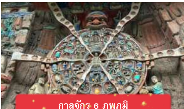
กาลจักร 6 ภพภูมิ