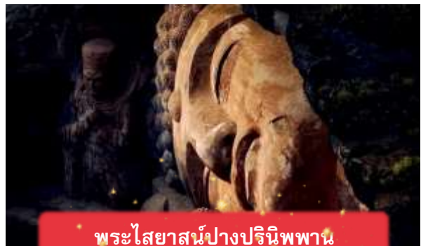
พระไสยาสน์ปางปรินิพพาน