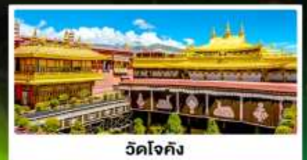
วัดโจกัง