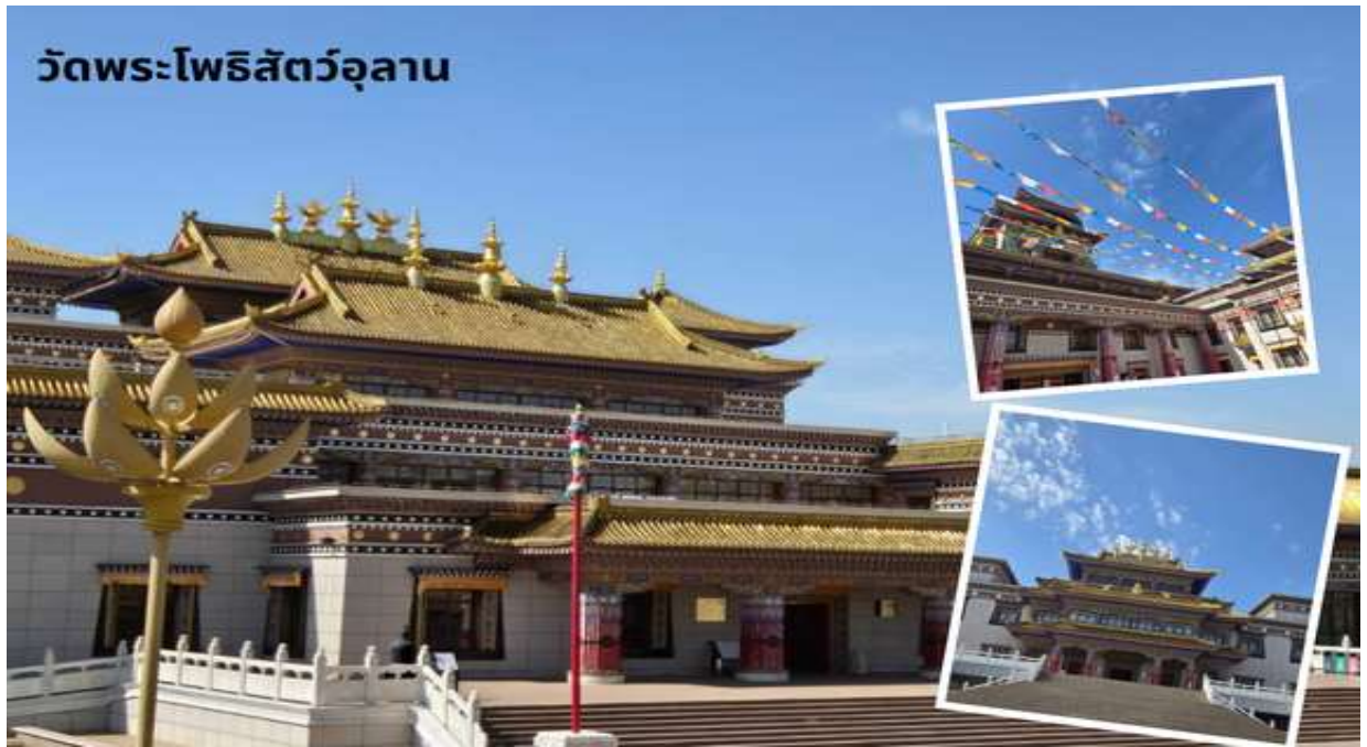
วัดพระโพธิสัตว์อุลาน