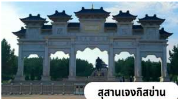
สุสานเจงกิสข่าน

นำท่านไปยังศูนย์วัฒนธรรมมองโกล หยวนหลิว (Yuanliu Mongolian Culture Center) เป็นสถานที่ท่องเที่ยวในมองโกเลียในประเทศจีน ที่จัดแสดงประวัติศาสตร์และความยิ่งใหญ่ของจักรวรรดิมองโกลในยุคราชวงศ์หยวน จุดเด่นคือประติมากรรมประตูเมืองฉงเทียนที่สูงตระหง่านถึง 33 เมตร ยาว 399 เมตร ประดับด้วยกระเบื้องสีแดง 9 หลัง แสดงถึงวัฒนธรรมมองโกลผสมผสานกับสถาปัตยกรรมเอเชียตะวันตกได้อย่างงดงามและยังเป็นโรงถ่ายละครอีกด้วย นำท่านสู่สุสานเจงกิสข่าน(ชมด้านนอก) สถานที่แห่งความศักดิ์สิทธิ์และเป็นที่เคารพสักการะของชาวมองโกล ปัจจุบันได้รับการบูรณะ ประกอบด้วยพระตำหนักหลักสามหลัง สร้างขึ้นในรูปแบบสถาปัตยกรรมมองโกล รูปร่างคล้ายกระโจมขนาดใหญ่ อาคารเชื่อมต่อกันด้วยระเบียงทางเดิน ภายในประดิษฐานพระบรมรูปของเจงกิสข่านสูง 5 เมตร ทรงเครื่องรบเต็มยศอย่างองอาจกล้าหาญสง่างาม ด้านหลังเป็นภาพแผนที่ "สี่อาณาจักรข่าน" อันได้แก่ อาณาจักรข่านซาคาไต, อาณาจักรอิสข่าน, อาณาจักรโกลเดนฮอร์ด, และอาณาจักรหยวนของกุบไลข่าน พระตำหนักด้านหลังประดิษฐานหีบพระศพจำลองคลุมด้วยผ้าแพรสีเหลือง ซึ่งบรรจุสิ่งของส่วนพระองค์ (ไม่รวมค่าเข้าชมภายใน ราคาท่านละ 90 หยวน)