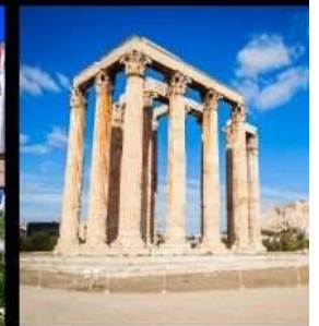
Temple Of Olympian