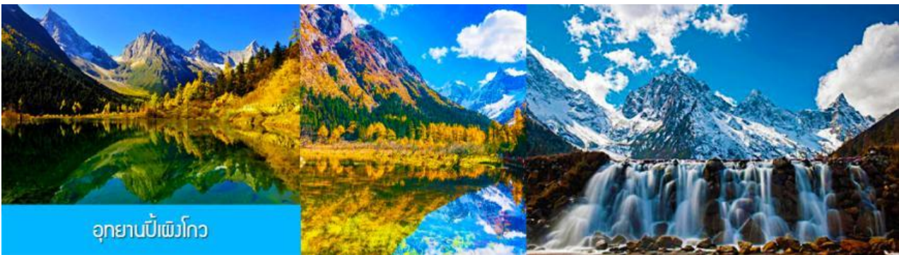
อุทยานเป่ย์ผิงโกว

หลังอาหารเช้าท่านเที่ยวชม อุทยานเป่ย์ผิงโกว 毕鹏沟景区 ที่เป็นแหล่งท่องเที่ยวธรรมชาติที่สวยงามได้รับฉายาว่าเป็นสวิตเซอร์แลนด์แดนใต้แห่งเมืองเสฉวน ตั้งอยู่เหนือระดับน้ำทะเลระหว่าง 2,015 เมตร – 3,500 เมตร ครอบคลุมพื้นที่ 614 ตารางกิโลเมตร ได้รับการขึ้นทะเบียนเป็นอุทยานท่องเที่ยวธรรมชาติระดับ 4A ของจีนในปี ค.ศ. 2013 และกลายเป็นอุทยานท่องเที่ยวยอดนิยมที่มีนักท่องเที่ยวเดินทางมาเยือนในปี 2023 ...นำท่านขึ้นรถบัสของอุทยานเพื่อเข้าไปยังเขตอุทยาน นำท่านขึ้นรถกอล์ฟแวะเที่ยวจุดชมวิวสำคัญต่าง ๆ ภายในเขตอุทยาน ที่ประกอบด้วย ธารน้ำแข็งและภูเขาหิมะ โอบล้อมอุทยาน ทะเลสาบที่มีสีน้ำเขียวมรกต ป่าไม้ ลำธารน้ำใสสะอาด น้ำตก หุบเขายาวนพื้นที่สูง ใบไม้เปลี่ยนสีและป่าไม้หลากสีในฤดูใบไม้ร่วง หุ่นดอกไม้ในฤดูใบไม้ผลิ โดยมีจุด