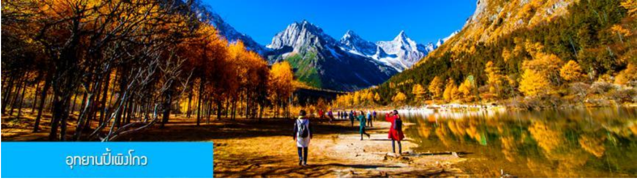
อุทยานเป่ย์ผิงโกว