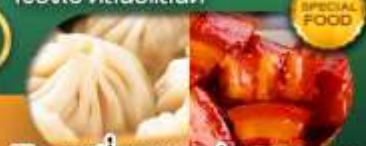
พิเศษ เสี่ยวหลงเป่า หมูแดงพอ เดินทาง ม.ค. - มิ.ย. 69