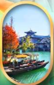
เมืองโบราณผู่หยวน