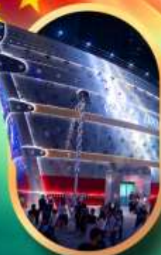
เรือคองคอลลี