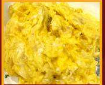
ไข่เจียวทรงเครื่อง