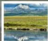
ดวงดาวหิ่งถ่าง