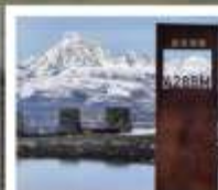
ป่ากลางเจียงตู