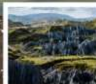
สวนหินป่าเหมย