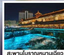
สะพานโบราณหนานเฉียว