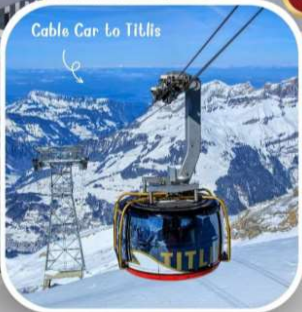
Cable Car to Titlis