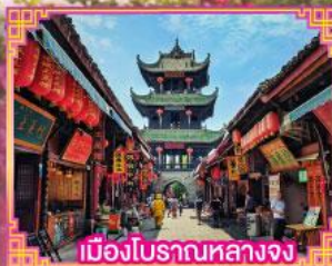
เมืองโบราณหลางจง