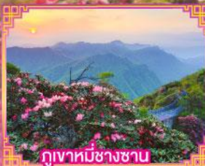
ภูเขาหิมะชางซาน