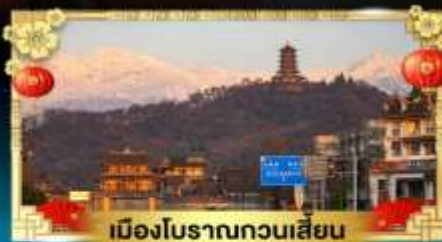
เมืองโบราณทวนเสียน