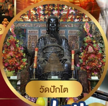
วัดปักโต