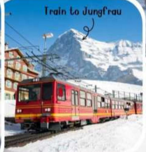
Train to Jungfrau