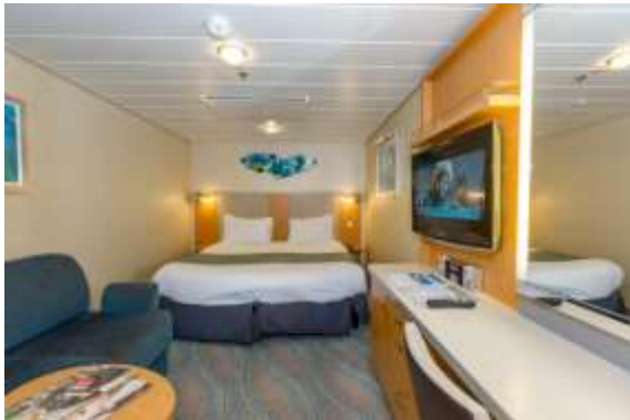
OCEAN VIEW CABIN